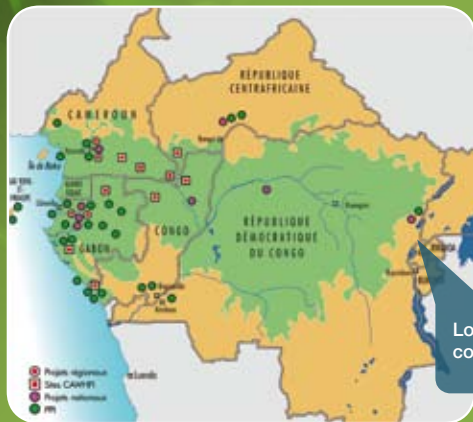
Localisation des projets cofinancés par le FFEM.

PAF Gabon - Appui à l'aménagement forestier durable au Gabon