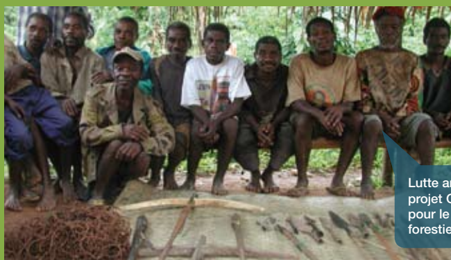
Lutte anti-braconnage - projet CAWHFI, initiative pour le patrimoine mondial forestier d'Afrique centrale

Les forêts couvrent environ 2 millions de km 2